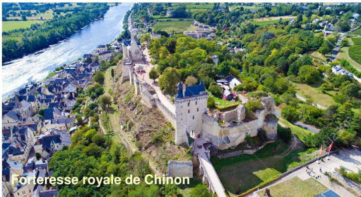
Forteresse royale de Chinon