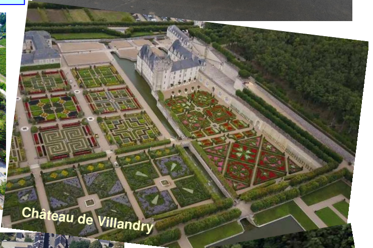
Château de Villandry