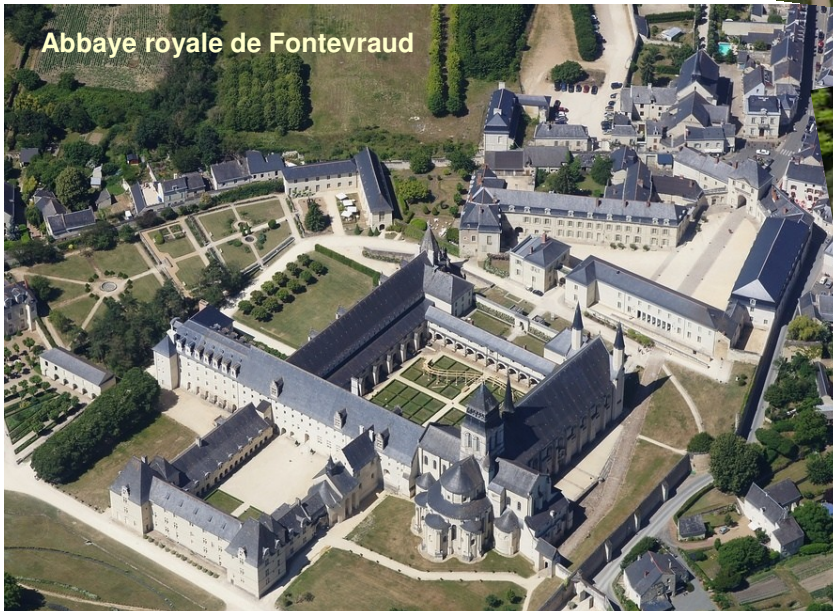
Abbaye royale de Fontevraud